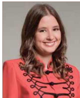
Dúró Dóra országgyűlési képviselő, a Jobbik Oktatási Kabinetjének elnöke

A Jobbik szerint az, hogy az állam átveszi az alapfokú oktatási intézmények működtetését, önmagában semmilyen garanciát nem jelent arra, hogy a kistélepléseknak megmaradnak az általános iskoláik, ha ehhez továbbra sem társul megfelelő finanszírozás és elkötelezettség. Ráadásul ha a fenntartói jogokat elveszik az önkormányzatoktól, akkor a helyi közösségek önrendelkezési joga is jelentősen sérül.